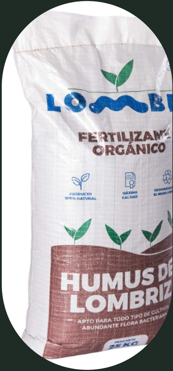
SACOS 4 kg, 15 kg, 25 kg.