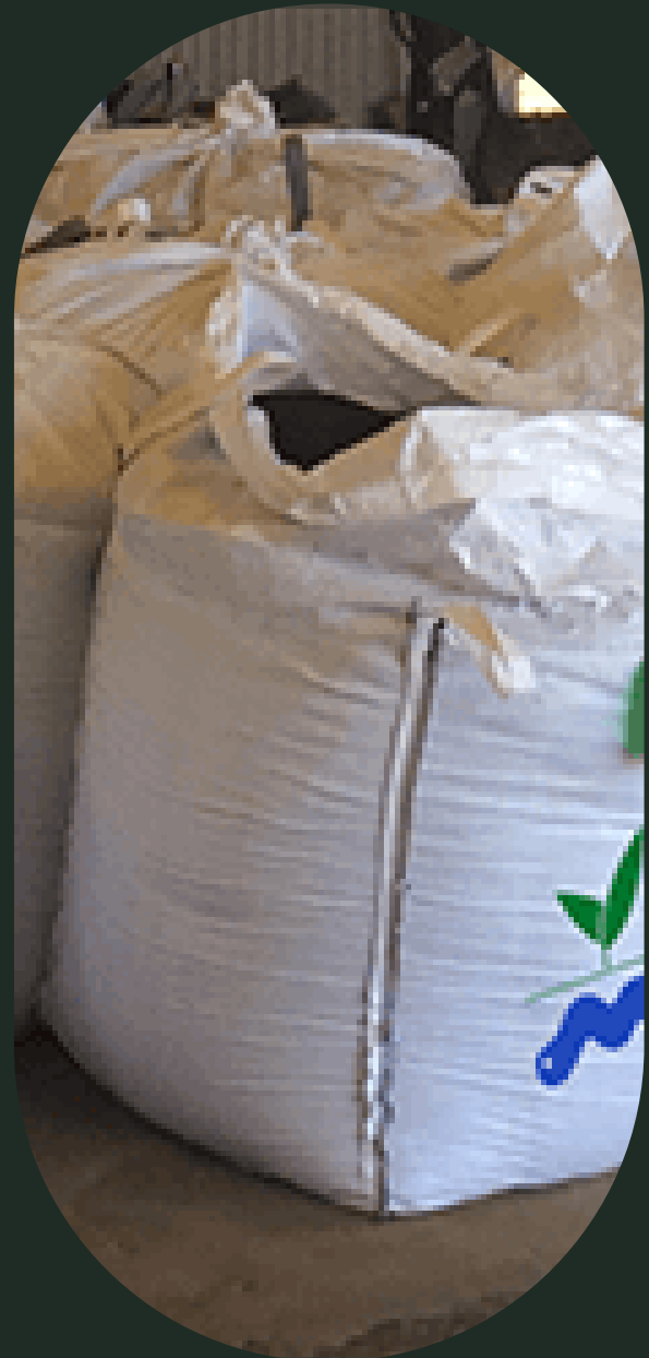
BIG BAG 750 kg.