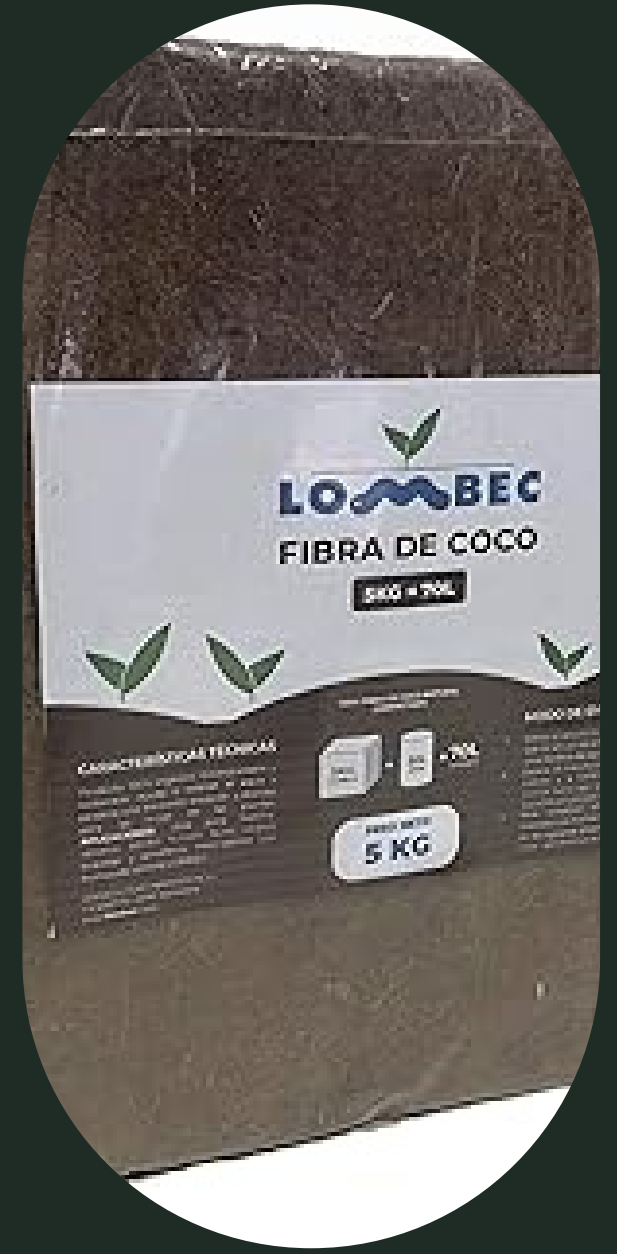
FIBRA DE COCO